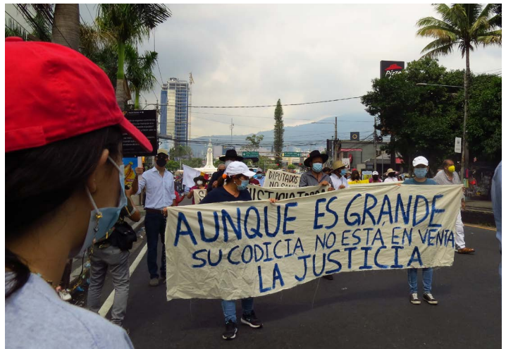
Jueces afectados por las reformas a la Ley de la Carrera Judicial se hicieron presentes para exigir el respeto al Estado de Derecho.