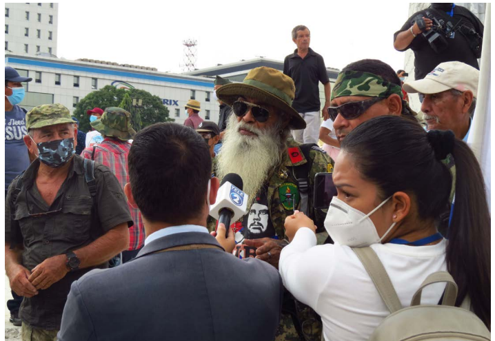
Veterano de guerra da declaraciones a la prensa.

El 30 de septiembre los y las salvadoreñas en su calidad de ciudadanos se hicieron presentes para protestar para exigir independencia del organo judicial, la derogacion de la Ley Bitcoin, entre otros. Tomandose la Alameda Franklin Delano Roosevelt y llegando hasta el Palacip Legislativo.