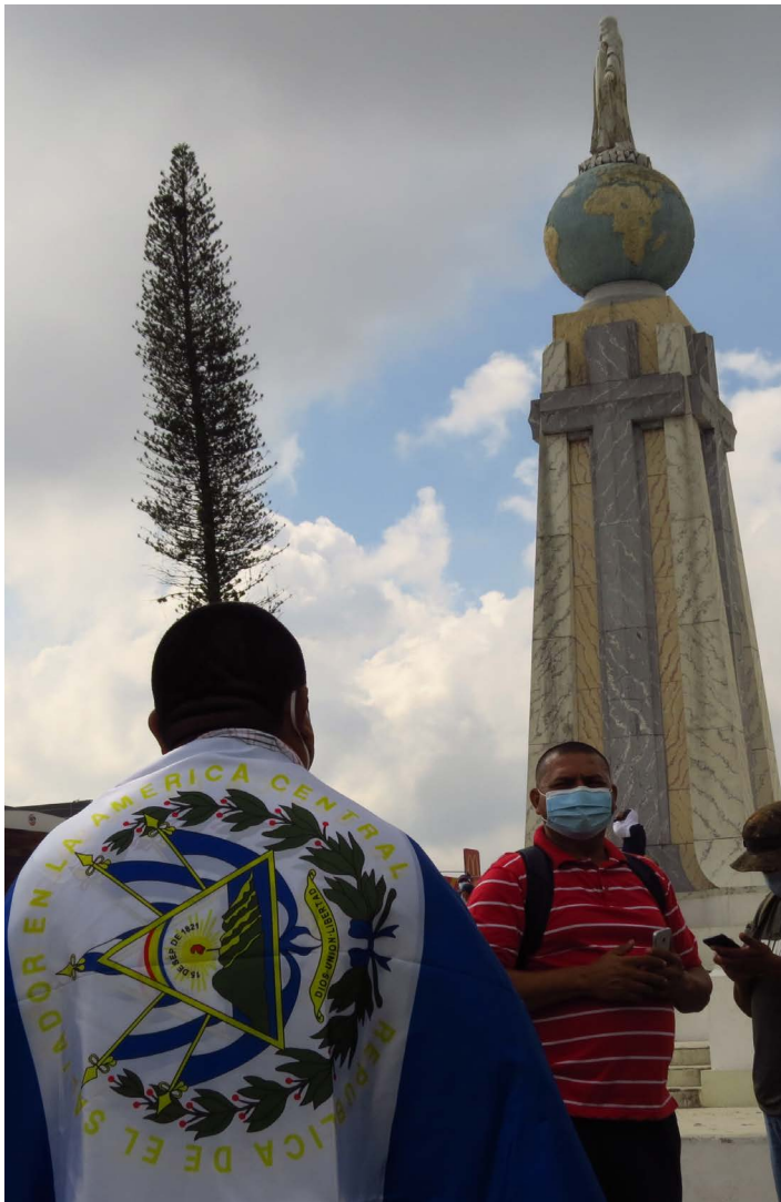
Ciudadanas se hicieron presente para mostrar su descontento haciendo uso de distintivos patrios.