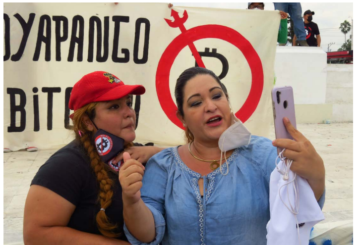
Ciudadanas se hicieron presente para mostrar su descontento.